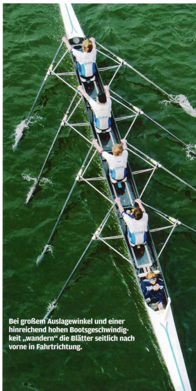
Bei großem Auslagewinkel und einer hinreichend hohen Bootsgeschwindigkeit „wandern“ die Blätter seitlich nach vorne in Fahrtrichtung.

Mit dem Setzen des Blattes wird der Druck auf die Beine genommen. Bei einem großen Auslagewinkel und einer hinreichend hohen Bootsgeschwindigkeit „wandern“ die Blätter seitlich nach vorne in Fahrtrichtung; es erfolgt die Streckung der Beine, der Einsatz des Oberkörpers und schließlich der Arme. Zur Erreichung eines hinreichend großen Auslagewinkels werden die Arme soweit gestreckt, dass sie ein gleichschenkeliges Dreieck bilden.