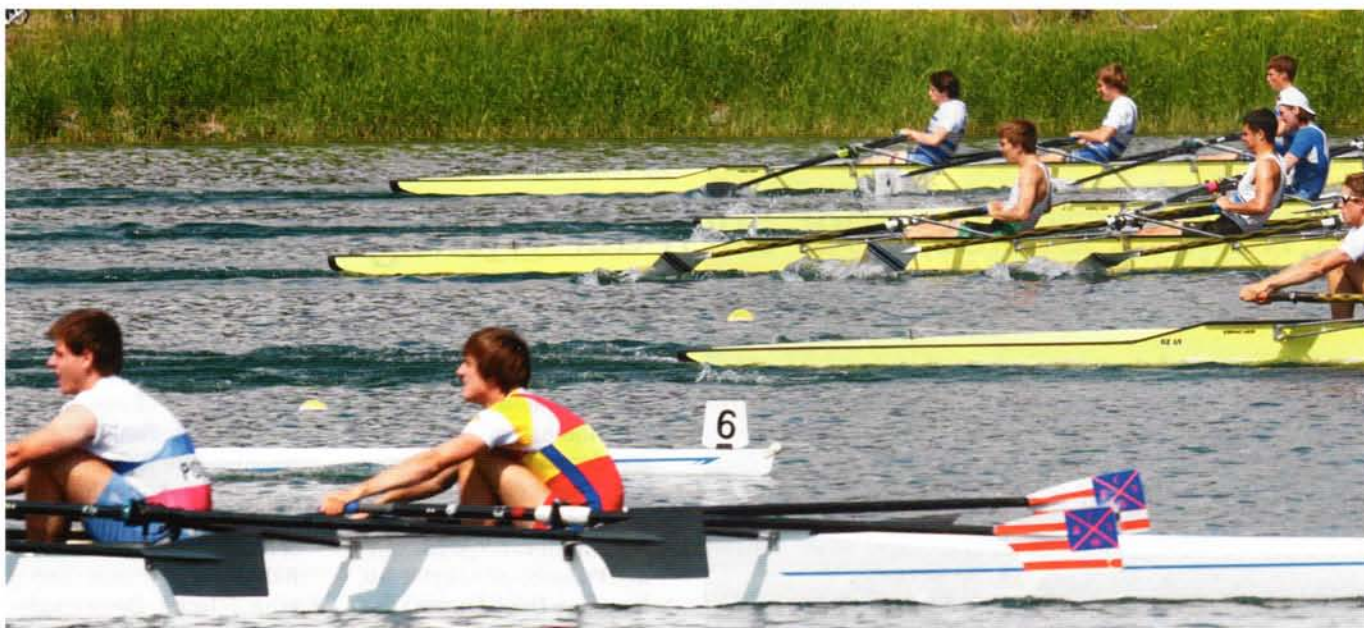
Die Griffe werden vor dem Setzen ins Boot gedrückt. Folge: Die Blätter sind in der Auslage zu weit vom Wasser weg.

Rudermannschaft, soll ohne Weg- und Zeitverlust das Ruderblatt/die Ruderblätter ins Wasser setzen können.