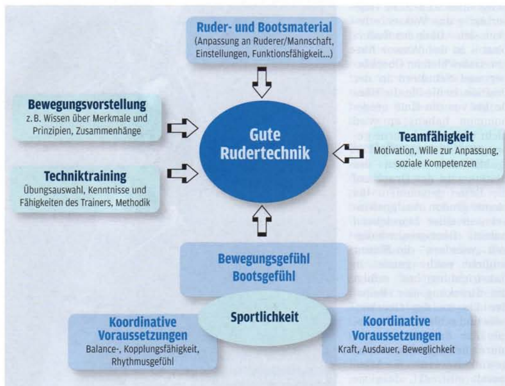
Abb. 1: Ursachen und Bedingungsfaktoren einer guten Rudertechnik (Fritsch 2010)